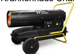
Diesel Heizkanone Krankenhaus Charkiw

Die Empfängerin der Unterstützung, Inna Rafienko, kümmert sich um geflüchtete Menschen aus Front- und unmittelbaren Kampfgebieten, sowie um Familien, beeinträchtigte Menschen und Betagte, die in Charkiw verblieben sind.